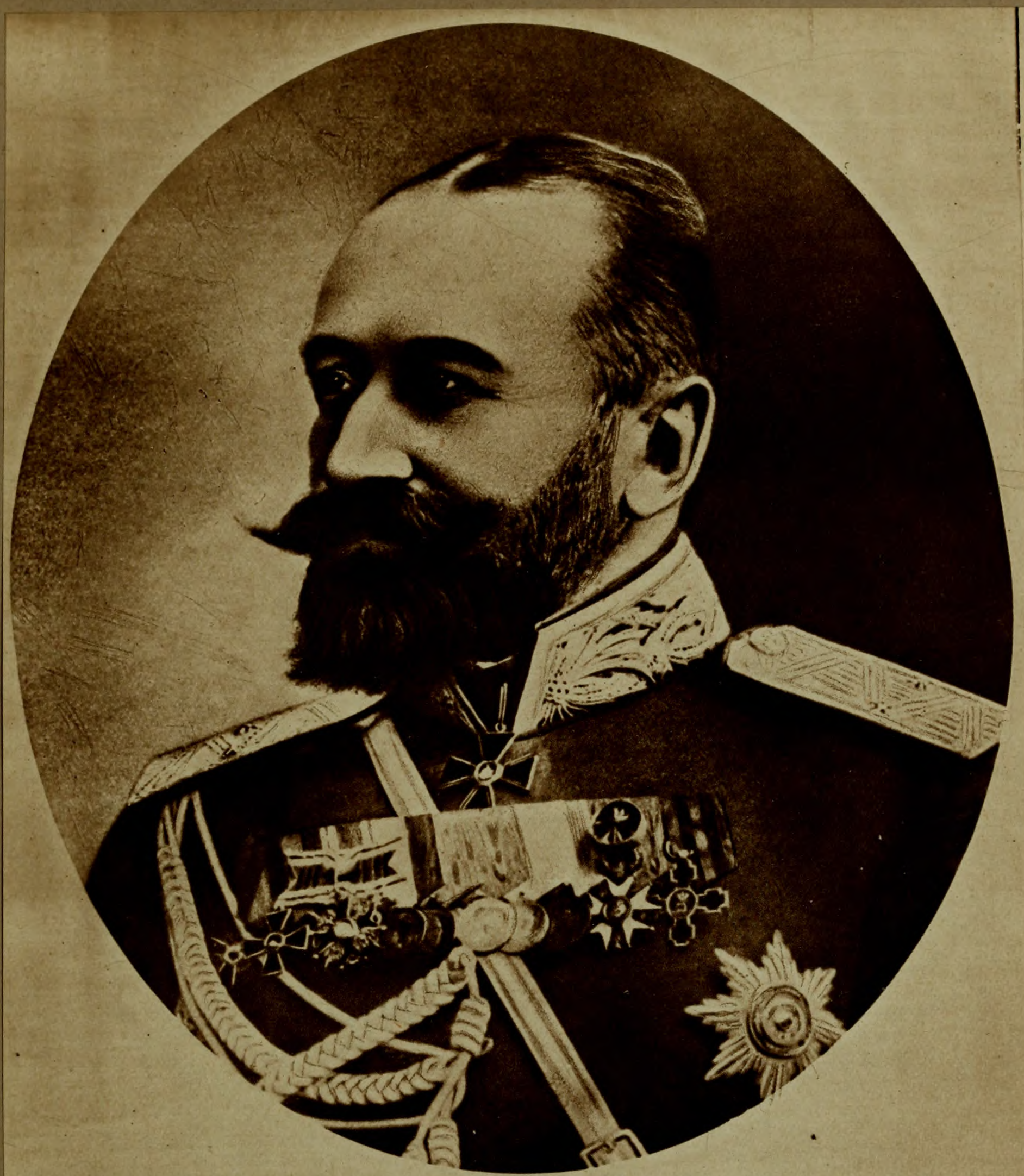
ВОЕННЫЙ МИНИСТРЪ Генераль-отъ-инфантеріи А. А. ПОЛИВАНОВЪ.